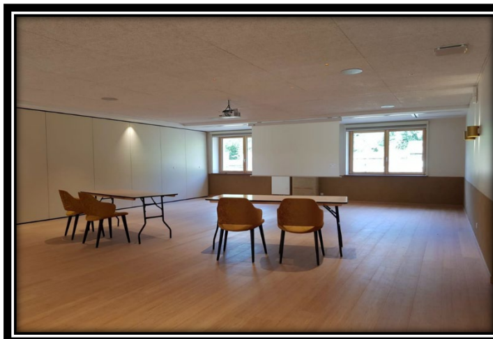
La salle n°1

100 m 2 pour 50 personnes, un espace intime et chaleureux. Plateau technique (son, écran, vidéoprojecteur)