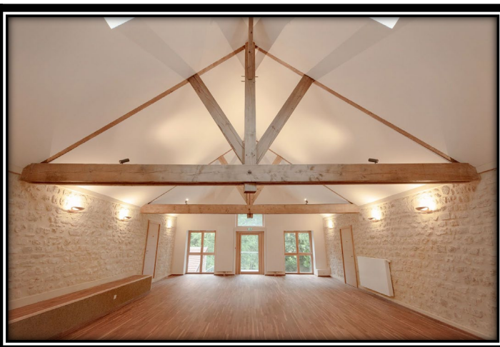
La salle Yoga